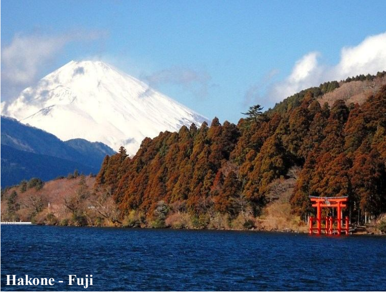
Hakone - Fuji

كما تقدم جولات بالقرب من طوكيو - Fuji - Hakone